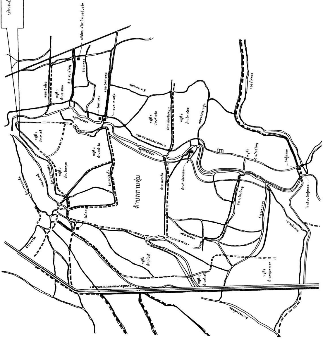
แผนที่ตั้งขย 1:200

บริเวณบ้าน มช ๕๑๑ ๕๑๒ ของส่วนแบ่งที่ดินระบบป่าชุมชน(กรณีใหม่) พื้นที่ 2 ตำบลตามทุ่ง